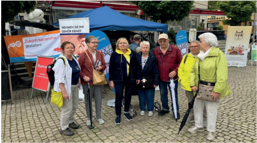
Die SHV-Gruppe vor dem Stand des Landesverbandes